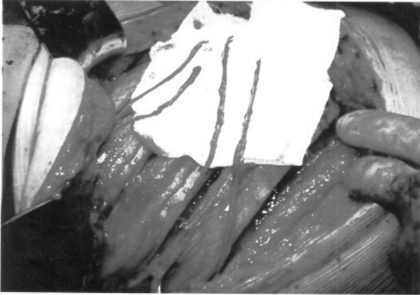
Şekil 2: Diseksiyon sonrası distalden kesilmiş ve anastomozu hazırlanacak interkostal sinirler.

uzunluğu artırmak için daha distal ve proksimalde diseksiyona devam edildi. Yeterli uzunluk saptanınca sinirler distal uçlardan kesilip, bu uçlara serbest sütürler kondu (Şekil 2). Torakotomi insizyonu anterior aksillar hatta kadar kapatılıp, distal kısım açık kalacak şekilde steril drape ile örtülüp, hasta supin pozisyona alındı ve deltopektoral oluk üzerinde, klavikuladan pektoralis major kasının alt sınırına ulaşan cilt, cilt-altı insizyonu sonrası brakial pleksus eksplorasyonuna başlandı. Sefalik ven korunarak m.pektoralis majör, humerus'a yapıştığı yerin yaklaşık 1 cm. uzağından kesildi. M.pektoralis minör geçildi. Lateral ve medial kordların ortaya konmasından sonra brakial arterin hemen anteriorunda seyreden median sinir identifiye edildi. Proksimale doğru takip edilerek lateral korda ulaşıldı ve lateral kordun lateral yüzeyinden orjin alan muskulokutanöz sinir ortaya kondu. Muskulokutanöz sinir mümkün olduğunca distalden, m.korakobrakialis'e girdiği yere yakın olacak şekilde kesilerek anastomoz için hazırlandı.