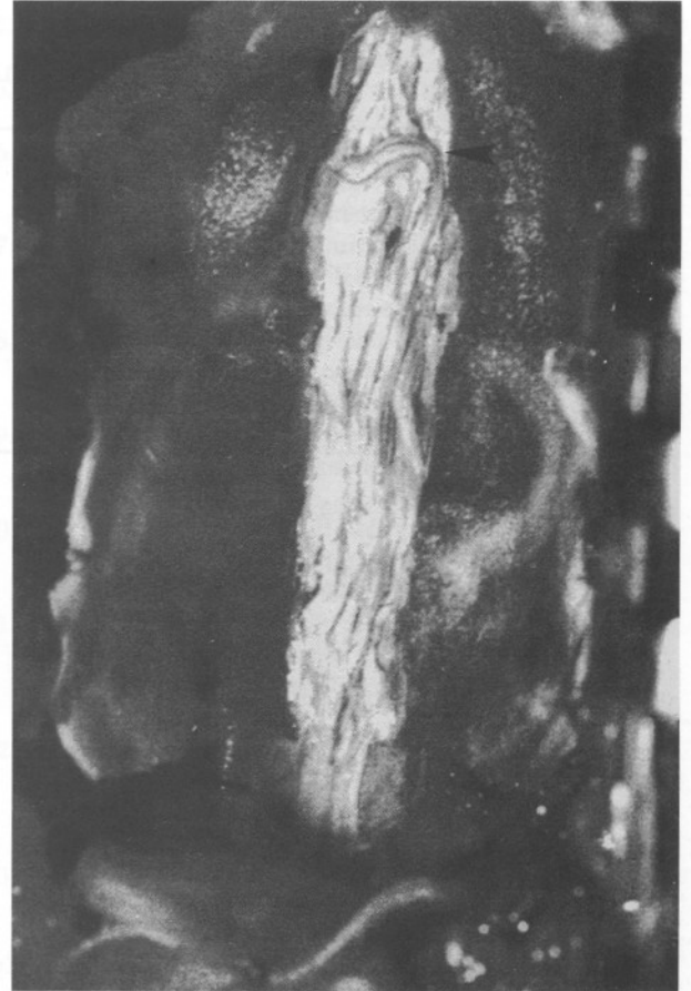
Şekil 3: Ameliyat fotoğrafı; normalden kalın, kıvrımlı, aşırı uzamış sinir kökleri görülmektedir.

RNRS etyolojisi ve patolojisi kesin olarak bilinmeyen seyrek görülen klinik bir durumdur. Bu sendromun temel özelliği kauda equinada anormal uzunlukta, aşırı kıvrımlı sarmallar oluşturmuş, bazen fazla kalınlaşmış spinal sinir kökü veya köklerinin görülmesidir. Sıklığı konusunda kesin veriler olmamakla birlikte, 1954'te Verbiest'in ilk yayınından bu yana literatürde 100'den daha az sayıda olgu bildirilmiştir (6,8). Suzuki ve ark. lomber spinal hastalığı olan ve myelografisi çekilen 1256 olgunun 55'inde (% 4,6) RNRS bulguları saptamışlardır (8).