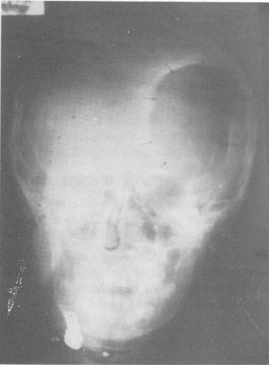
Şekil 2 : Sol oksipital kemik defektini gösteren kraniyografi.