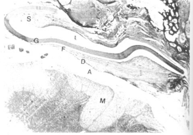
Resim 3: Dura mater ile Gore-Tex SM arasındaki ince fibröz doku. (S: Skar dokusu, G: Gore-Tex SM, F: Fibröz bant, D: Dura mater, A: Araknoid, M: Spinal kord) (HE 25X)

Gore-Tex SM ile kapatılan mesafelerde fibröz dokunun laminektomi mesafesini doldurduğu, ancak Gore-Tex SM'e herhangi bir yapışıklığın olmadığı gözlemlendi. Dura ile Gore-Tex SM arasında ise bant şeklinde ince bir fibröz dokunun geliştiği gözlemlendi (Şekil 3). Epidural skar dokusunun duraya olan yapışıklığı ve yoğunluğu Gore-Tex SM ile kontrol mesafesi arasındaki fark Wilcoxon testi ile karşılaştırıldığında istatistiksel olarak anlamlı bulundu ( p<0.01 ). Aynı şekilde Gore-Tex SM ile kemik greft konan mesafeler karşılaştırıldığında epidural skarın duraya yapışması ve yoğunluğu istatistiksel olarak anlamlı bulundu ( p<0.001 ).