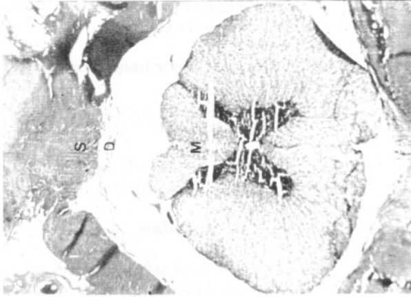
Resim 1: Kontrol mesafesi. (S: Skar dokusu, D: Dura mater, M: Spinal kord) (HE 25X)

çevrelediği, kemik greft ile dura arasını doldurduğu ve duranın tamamen skar dokusuna yapıştığı gözlemlendi (Şekil 2). Kontrol grubu ile karşılaştırıldığında anlamlı fark görülmedi ( p>0.05 ).