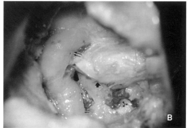
Şekil 2b: GTS yaklaşım sonrası hipofiz bezi (kalın ok), internal karotisin kavernöz parçası (büyük oklar) ile karotid arterin petroz kemiğin bir kısmı turlandıktan sonra görülen segmenti (küçük oklar) ve klivus (yıldız) turlandıktan sonra izlenmekte.