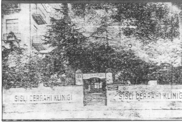
Şekil 4: Şişli Cerrahi Kliniği