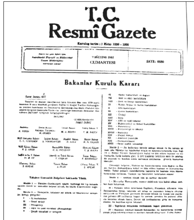
Şekil 3: Nöroşirürjinin bir ihtisas dalı olarak kabul edildiği 24 Temmuz 1947 tarih ve 6177 sayılı Bakanlar Kurulu kararının yer aldığı 6680 sayı ve 9 Ağustos 1947 tarihli Resmi Gazete.