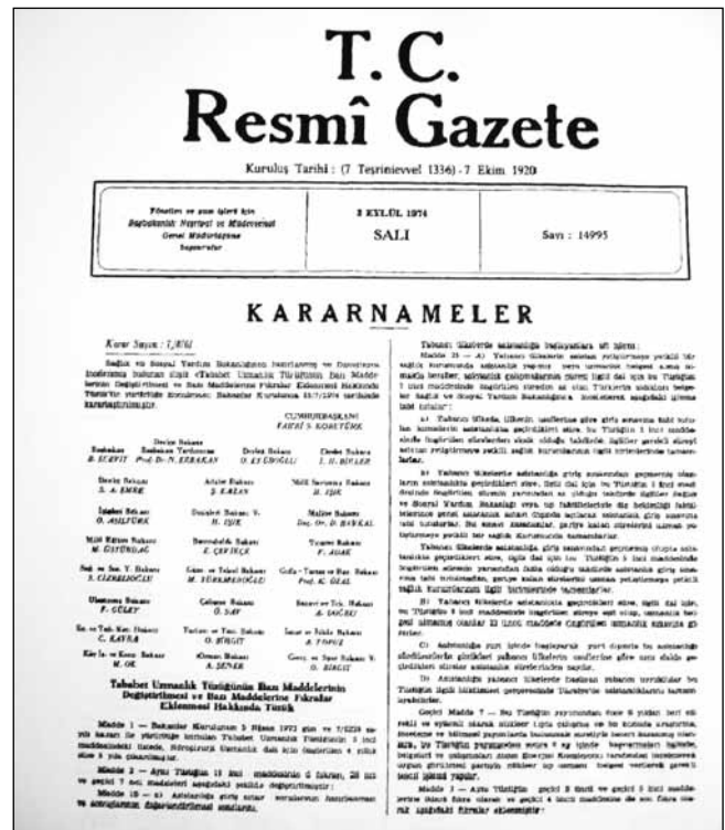
Şekil 9: İhtisas süresinin tekrar 5 yıla çıkarıldığı 3/09/1974 tarih ve 14995 sayılı resmi gazete.