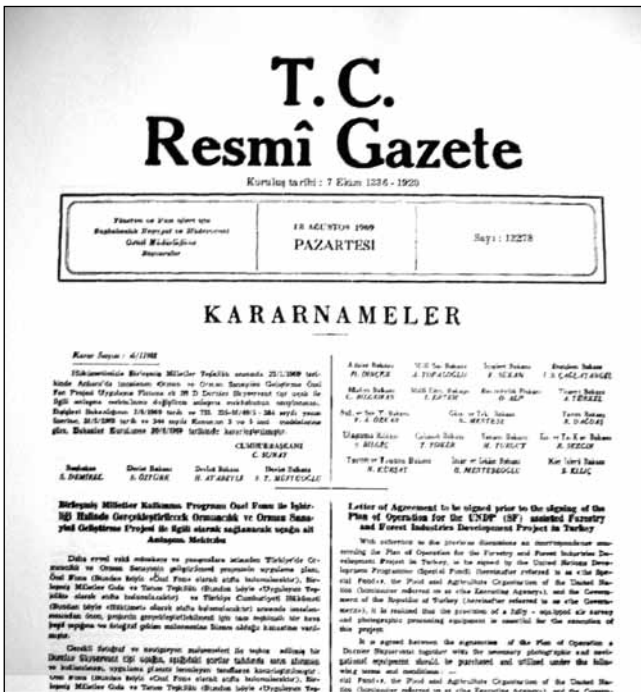
Şekil 7: Nöroşirürji ihtisasının ana dallar arasında sayıldığı ve doğrudan ihtisas yapılabileceğini bildiren 18/08/1969 tarih ve 13278 sayılı resmi gazete.

18/04/1973 tarih ve 14511 sayılı resmi gazetede yayımlanan 7/6229 karar sayılı tüzük değişikliği nöroşirürji ihtisas süresini 4 yıla indirirken, rotasyonları da 12 ay genel şirürji, 10 ay nöroloji, 2 ay anestezi ve reanimasyon olarak düzenlemiştir (Şekil 8). Bu tüzüğe göre genel şirürji üzerine 3 yıl, nöroloji üzerine 4 yıl olacak şekilde ek eğitimle nöroşirürji uzmanı olanağı devam etmektedir (20).