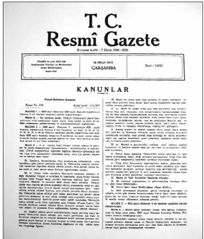
Şekil 8: Nöroşirürji ihtisas süresini 4 yıl, rotasyonları da 12 ay genel şirürji, 10 ay nöroloji, 2 ay anestezi ve reanimasyon olarak düzenleyen tüzük değişikliğinin yer aldığı 18/04/1973 tarih ve 14511 sayılı resmi gazete.

Daha sonra 19/06/2002 tarih ve 24790 sayılı resmi gazetede yayımlanan 2002/4198 karar sayılı bir tüzük ile ihtisas süresi 6 yıla çıkarılmıştır (24).